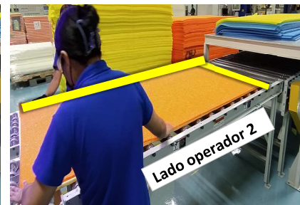
Alinear las orillas en forma de "L"

Aplanar las hojas para evitar la formación de ondas