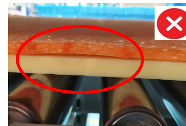
Con espacios donde entra el aire