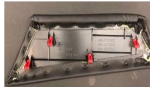
Knee pad extension- 4 clips rojos

Registro de primer pieza debe ser llenado: ACR304 910B Inspeccion de primer pieza Instalación de