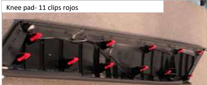
Knee pad- 11 clips rojos