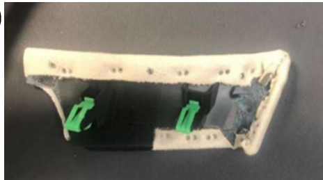
Dpad- 2 clips verdes