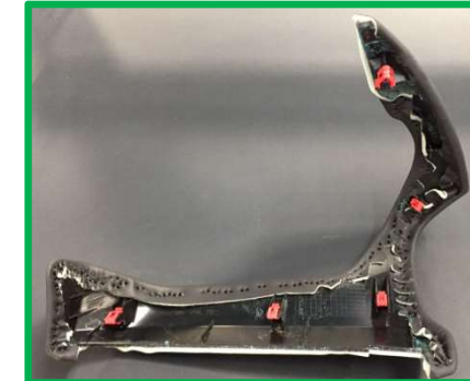
Dpad Lower, O uter (Cuierta)