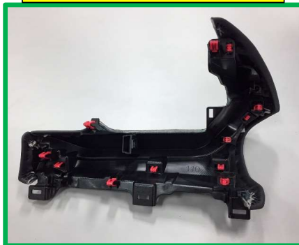
Dpad Lower E nsamblado 12