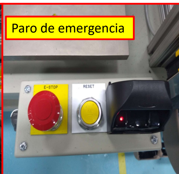
Paro de emergencia