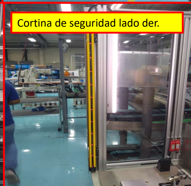
Cortina de seguridad lado der.