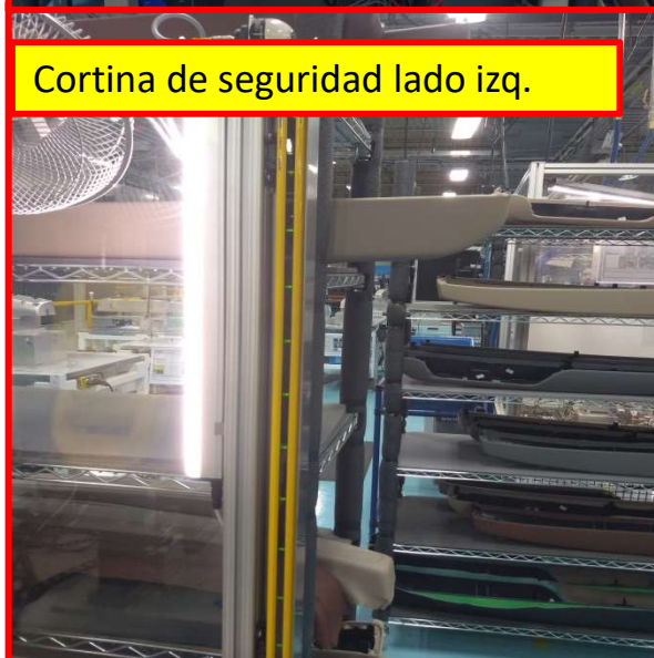
Cortina de seguridad lado izq.