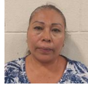
Foto del empleado Foto del empleado