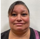
Foto del empleado Foto del empleado Foto del empleado