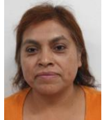
Foto del empleado Foto del empleado Foto del empleado